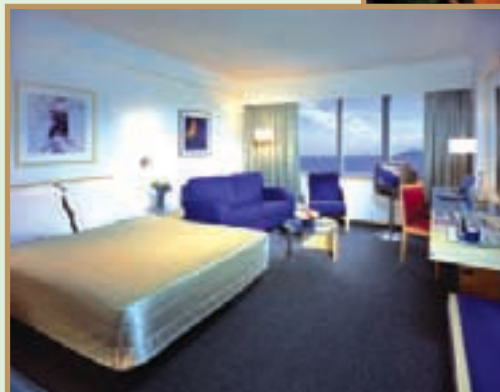
Spacious suites and guestrooms, well furnished and delicately planned. 套房及客房佈置優美，設置細意安排，空間寬敞。