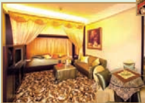
Theme suites decorated with different country themes being well received by hotel guests. 主題套房配以不同國家風情，深受酒店顧客歡迎。