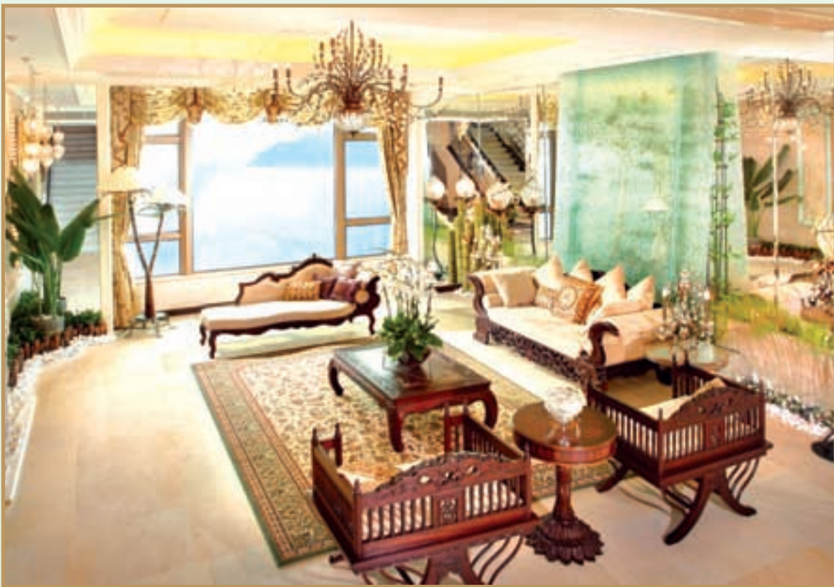
House full of Oriental Romance . 全屋充滿東方浪漫色彩。