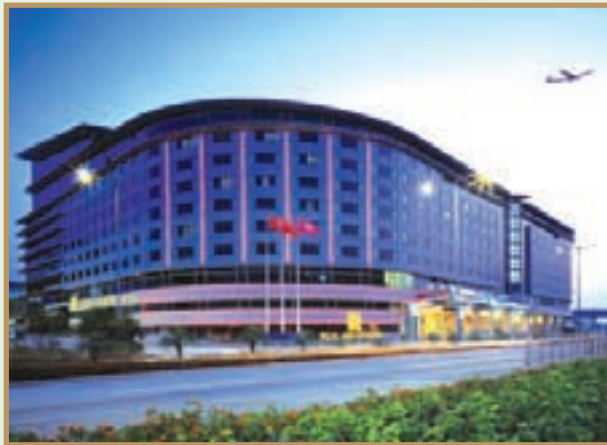
The 1,000 square meter pillarless Grand Ballroom is the largest hotel ballroom in Hong Kong. 面積達1,000平方米之無柱式大宴會廳乃香港最大型之酒店宴會廳。