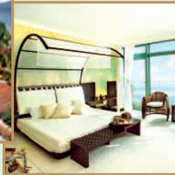
Lively Contemporary Thai styled house. 清新脫俗的時尚泰式擺設家居。