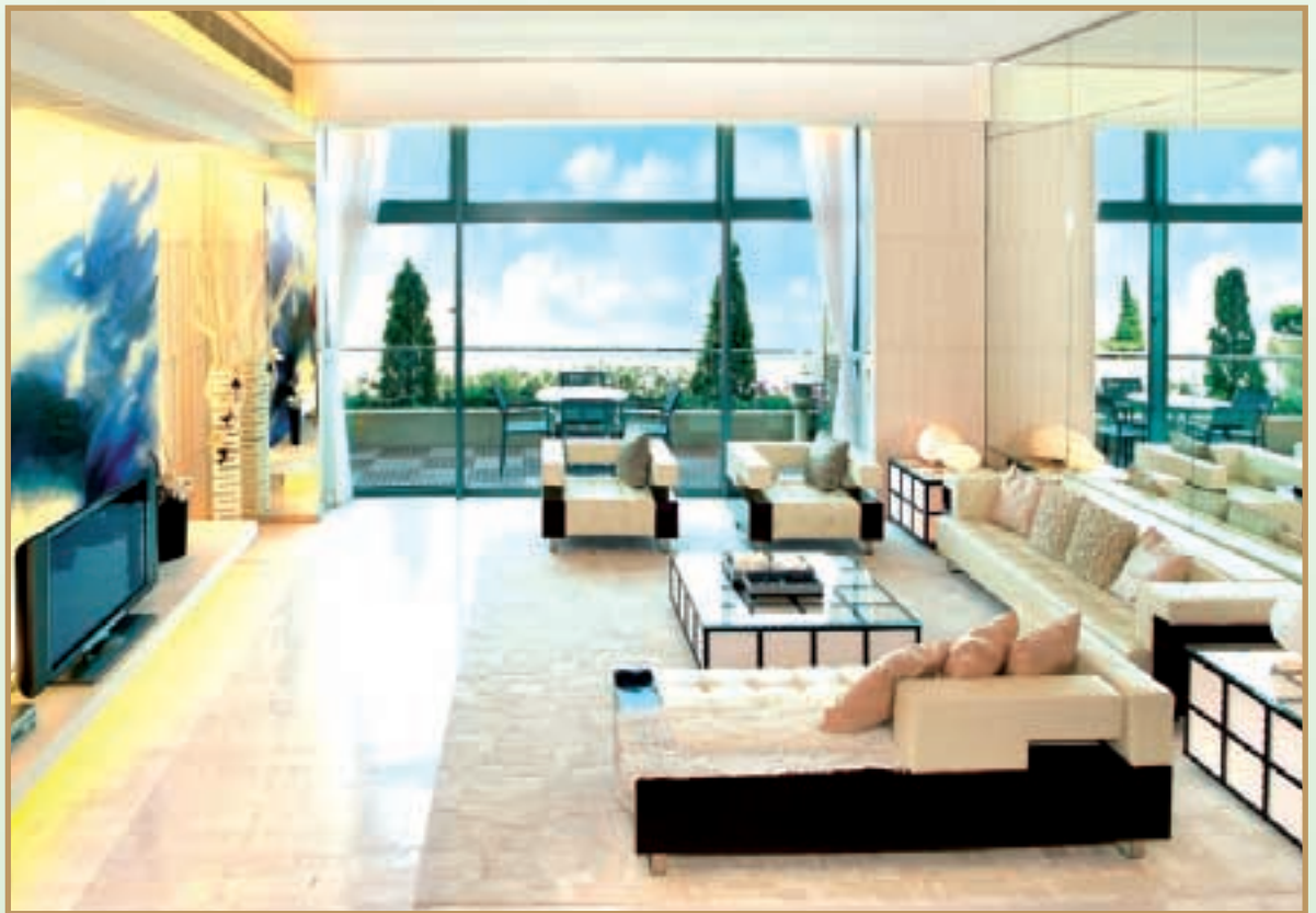
Elegant Contemporary Japanese styled house. 時尚日式設計，簡潔舒適。