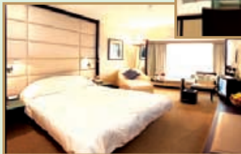
Renovated suites and guestrooms on Regal Club Executive Floor, well-appointed and gracefully furnished.