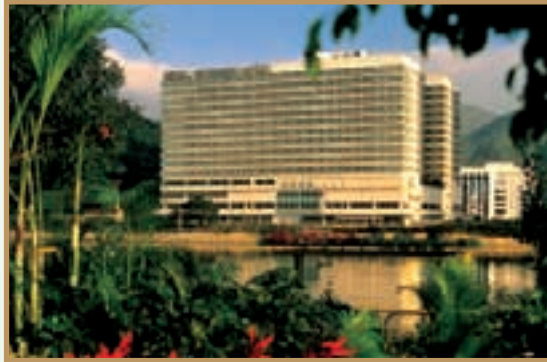
A city-resort hotel that offers a relaxing ambience. 環境清幽雅緻，恬靜怡人，乃城市中之度 假式酒店。