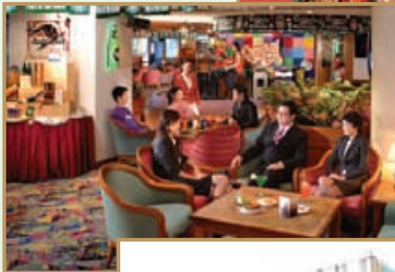
Perspective of the new hotel lobby. 酒店大堂的新面貌（透視圖）。