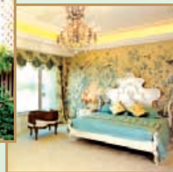
House decorated with English Country style. 英國鄉郊式之華麗佈置。