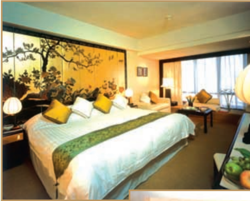
Deluxe room refurbished and filled with oriental culture. 客房裝修華麗，充滿東方文化氣色。