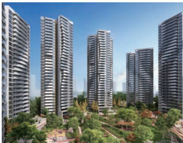
富豪國際新都薈富豪公館(第二期)之住宅大樓(*)