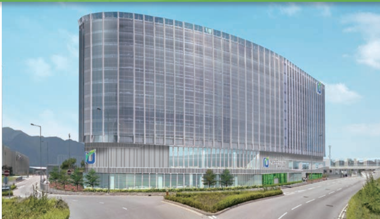
位於香港國際機場赤鱗角地段第3號將予命名為「麗豪航天城酒店」之新酒店項目 (*)