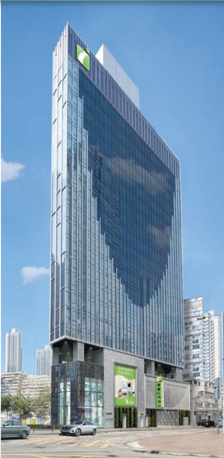
富薈旺角酒店 — 位於九龍大角咀晏架街2號