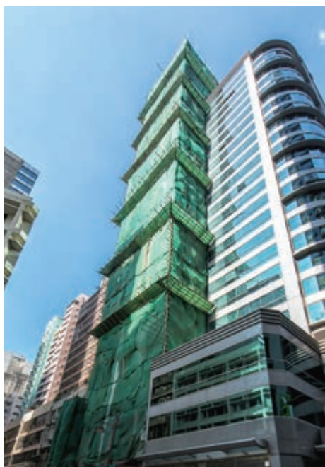
位於上環文咸西街5至7號及永樂街169至171號將予命名為「富薈上環II酒店」 — 上蓋建築工程大致完成