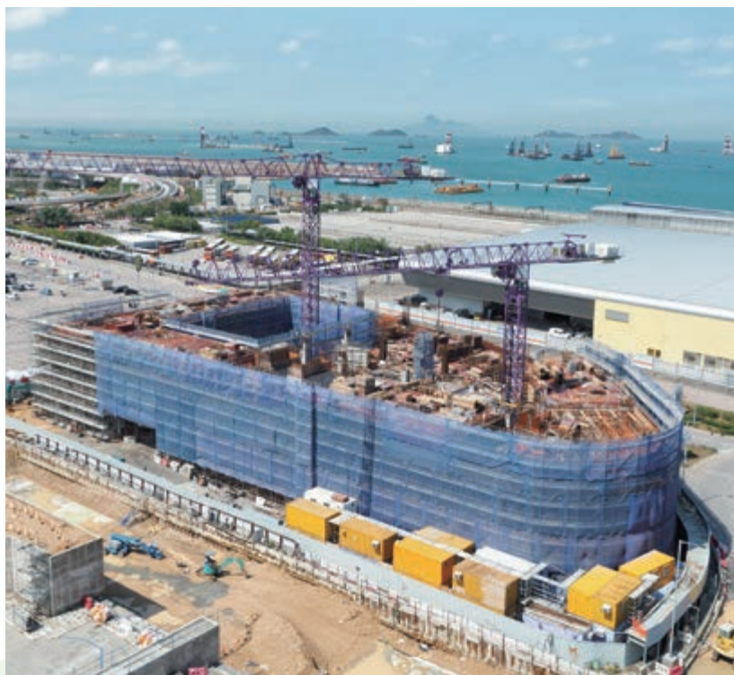
麗豪航天城酒店 — 上蓋建築工程進行中