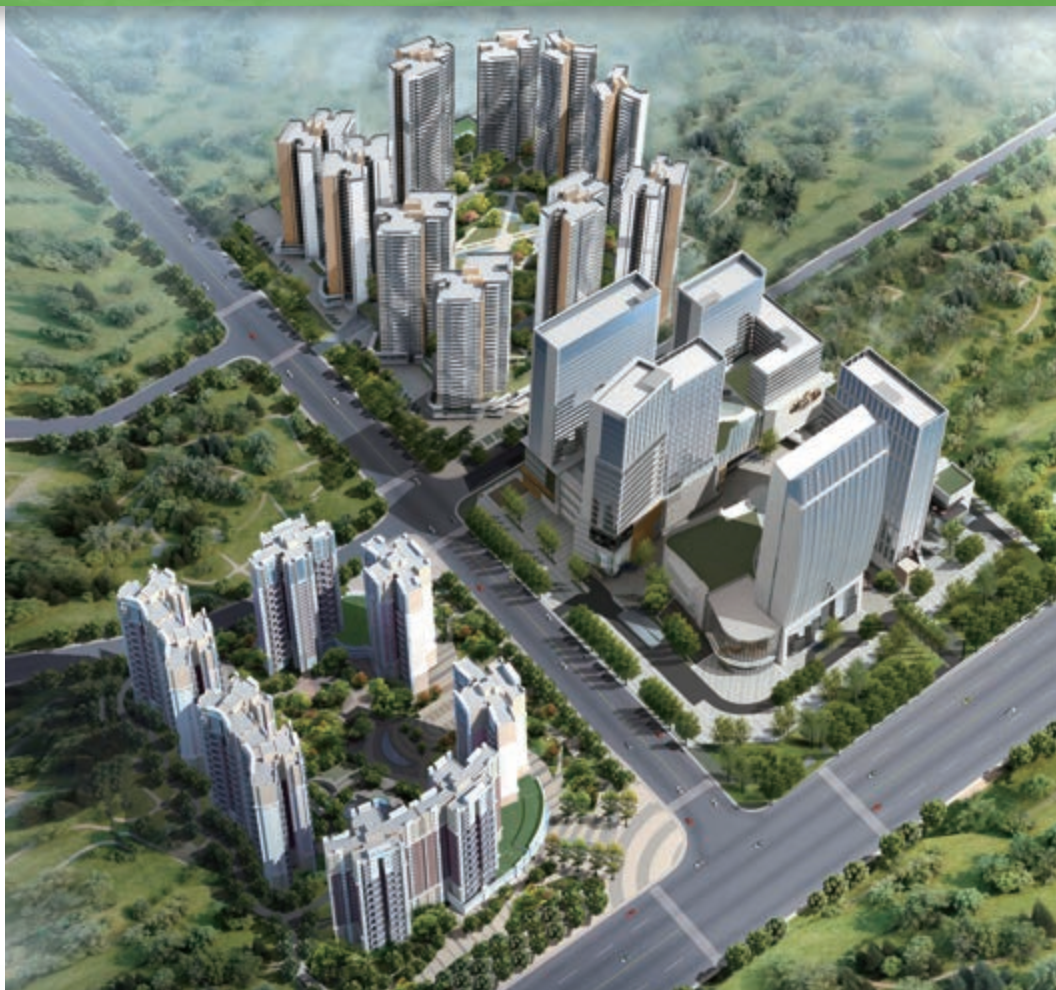
富豪國際新都薈 — 位於四川成都新都區之酒店/商業/寫字樓/服務式公寓/住宅綜合發展項目 (*)