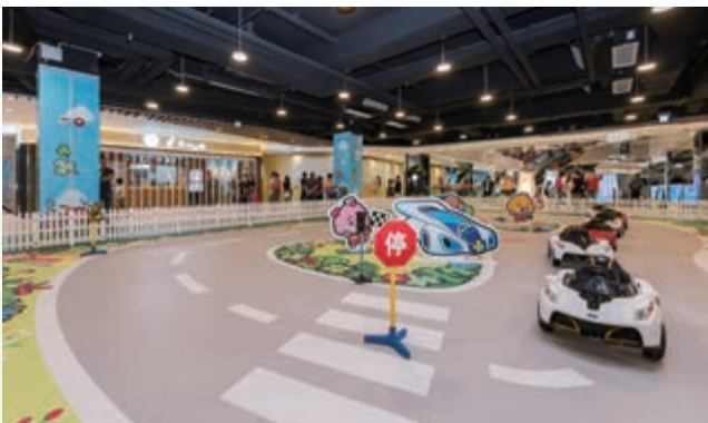
We Go MALL之極速小車神