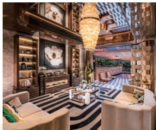
富豪 • 山峯之花園洋房的客廳