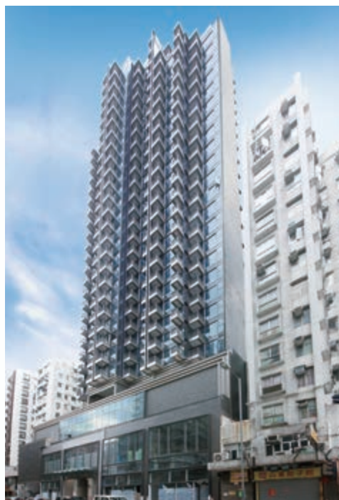
尚都 — 位於九龍深水埗順寧道 83 號之商業 / 住宅發展項目 — 已於二零一八年七月落成