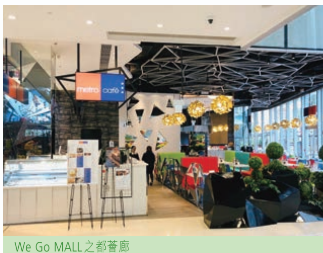
We Go MALL之都薈廊