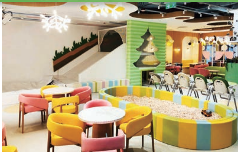
We Go MALL之智寶星親子餐廳