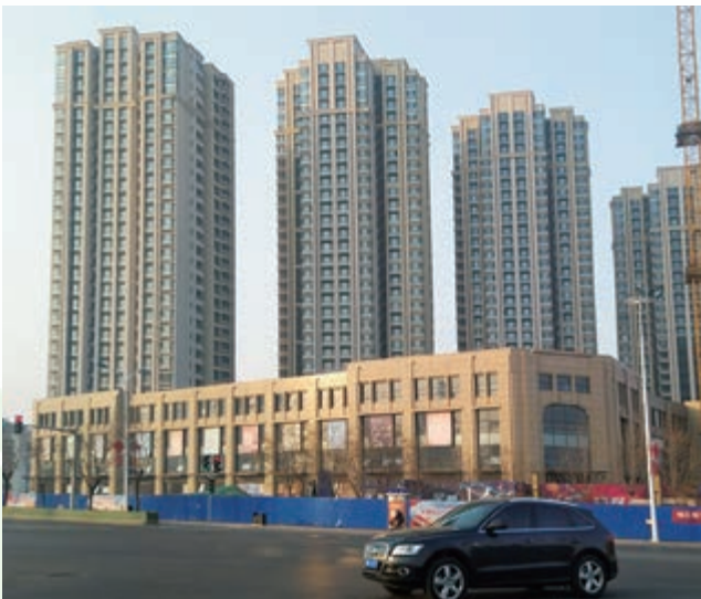
富豪新開門之住宅大樓及商業綜合大樓 — 已落成