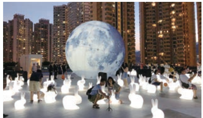
We Go MALL – 天台花園