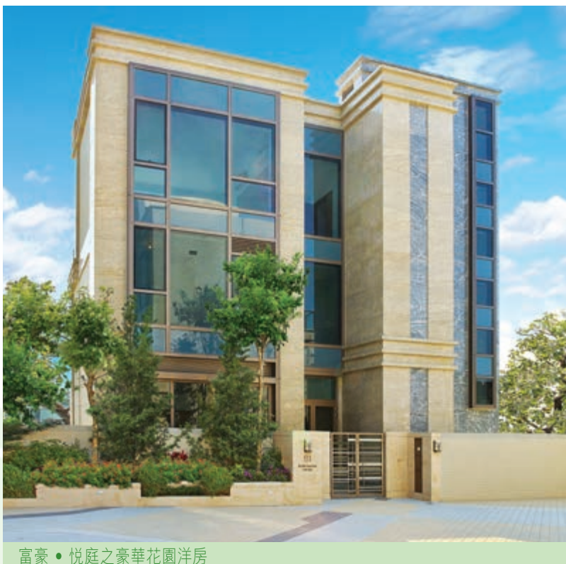
富豪 • 悦庭之豪華花園洋房