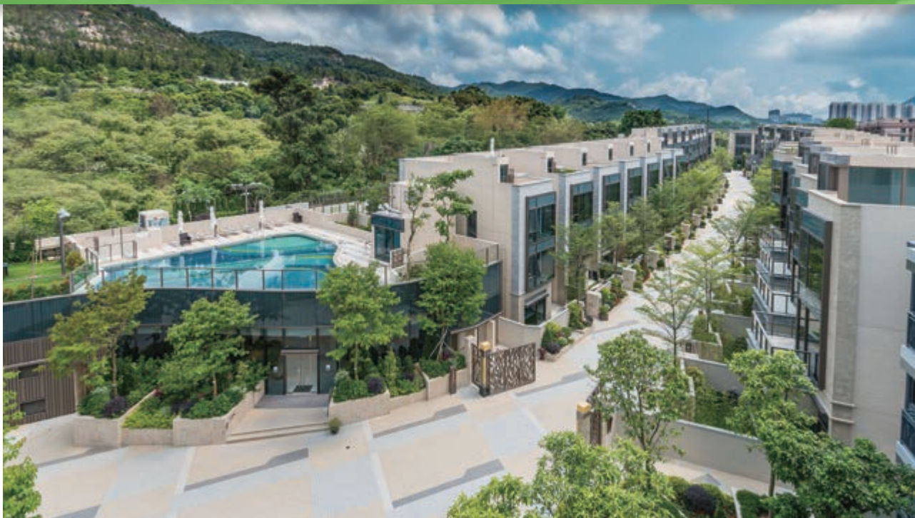
富豪 • 悦庭 — 位於新界元朗丹桂村路 65 至 89 號之住宅發展項目之花園洋房