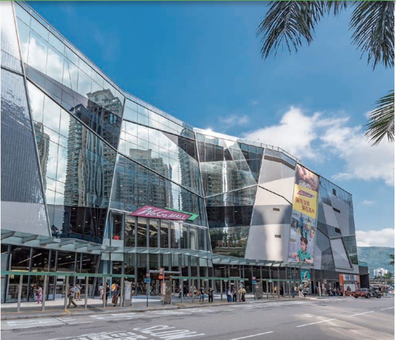
We Go MALL – 位於新界沙田馬鞍山保泰街16號之購物商場