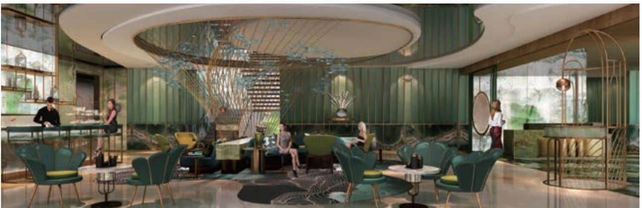
麗豪航天城酒店之貴賓酒吧及酒廊(*)