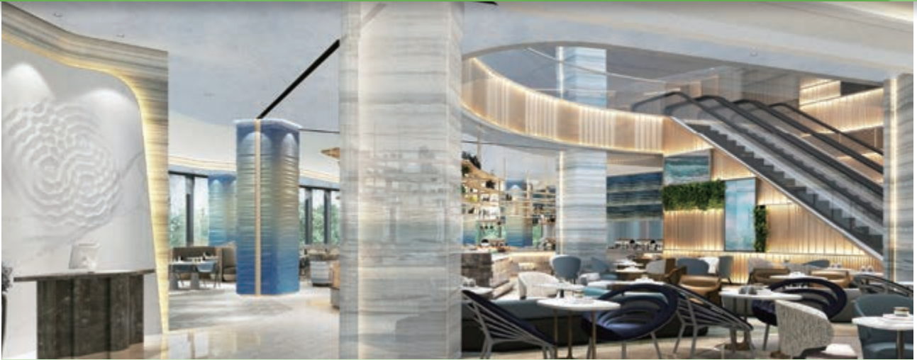
麗豪航天城酒店之主要入口(*)