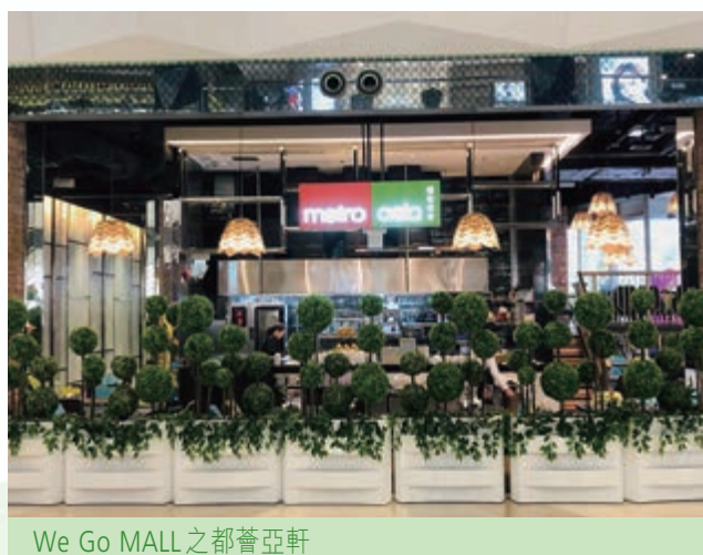
We Go MALL之都薈亞軒