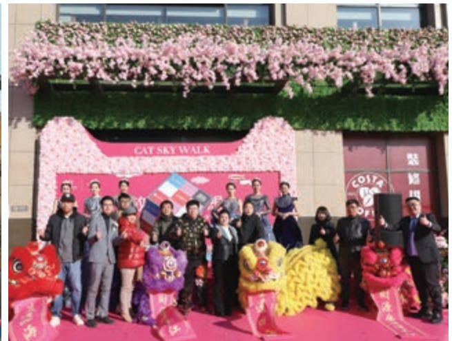
富豪新開門之購物步行街「貓步天街」 — 二零一八年十二月隆重開幕