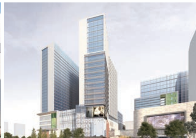
富豪國際新都薈之商業大樓/寫字樓(*) — 更新設計方案已獲批准