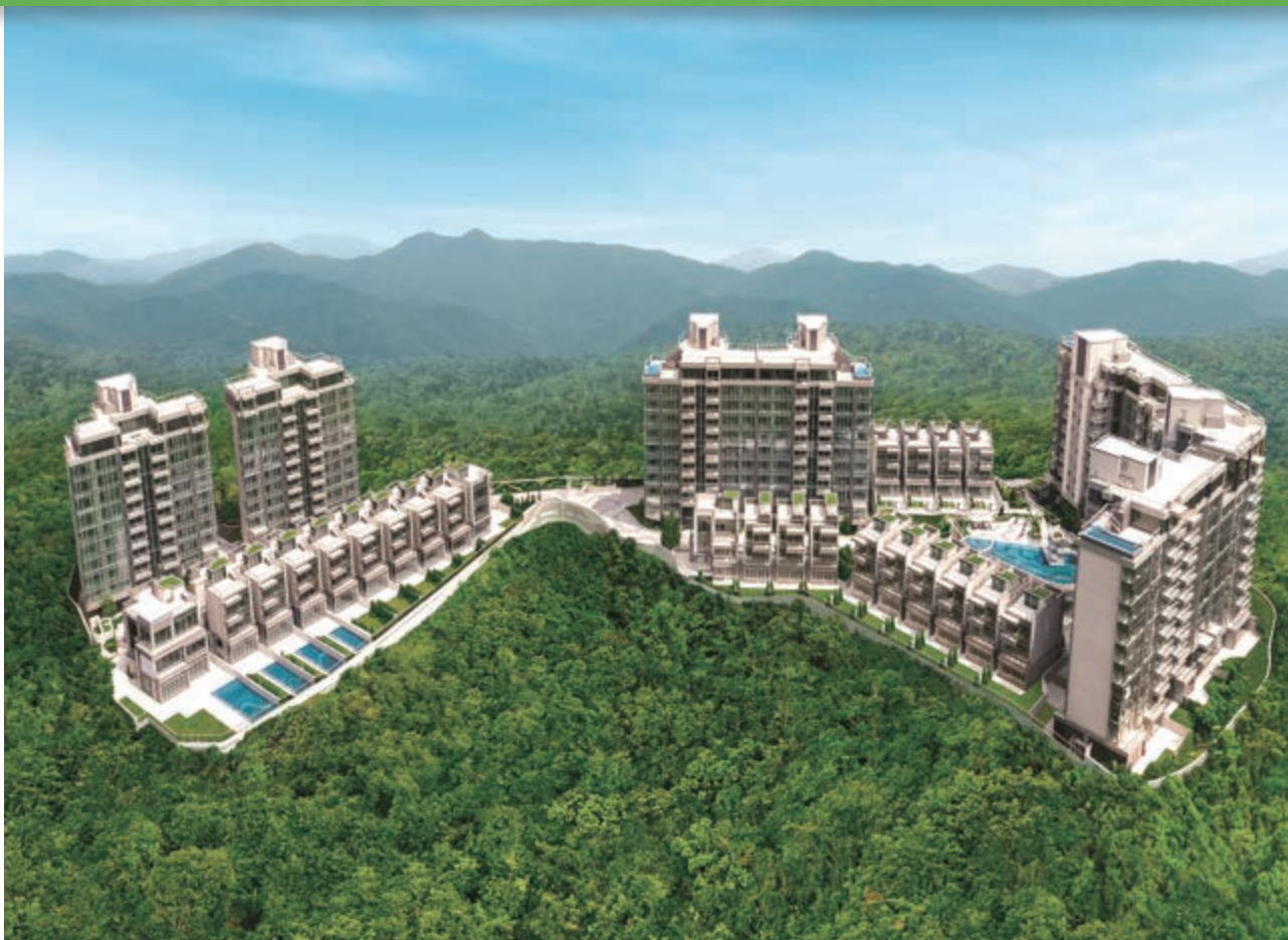
富豪 • 山峯 — 位於新界沙田九肚麗坪路23號之豪華住宅發展項目