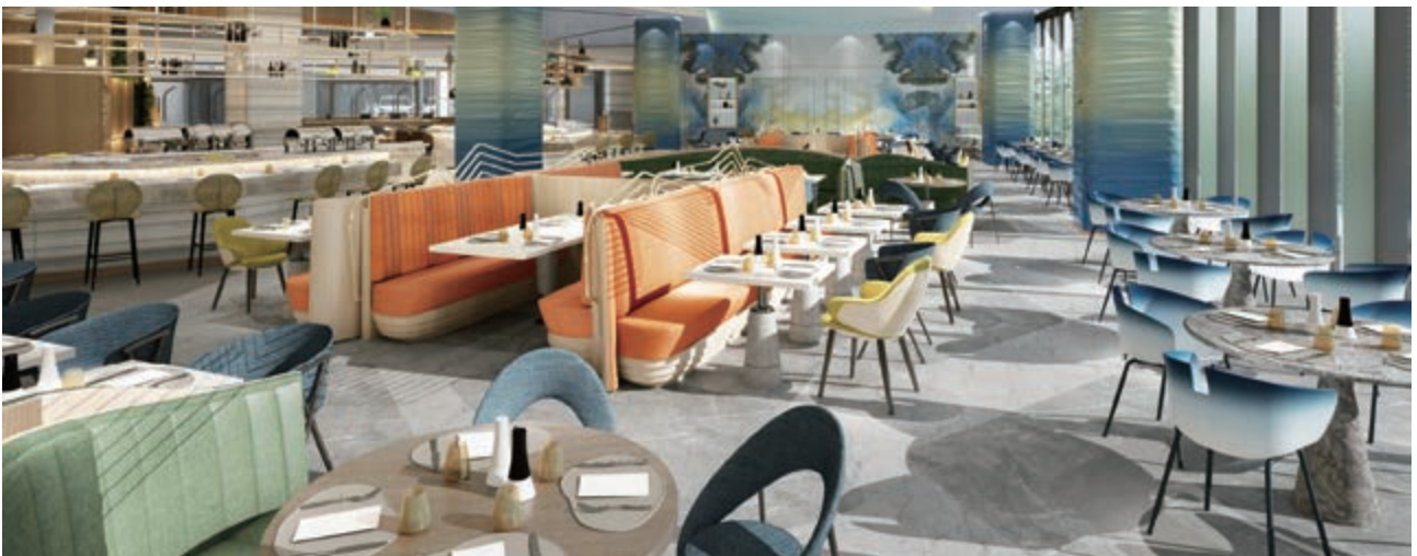
麗豪航天城酒店之餐廳(*)