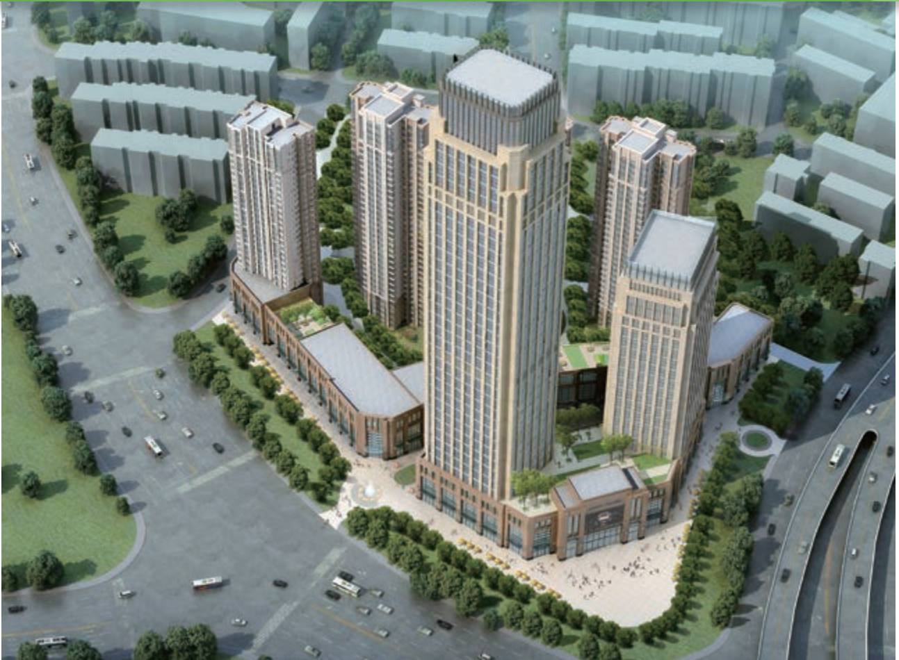
富豪新開門 — 位於天津河東區黃金地段之商業/寫字樓/住宅綜合發展項目(*)