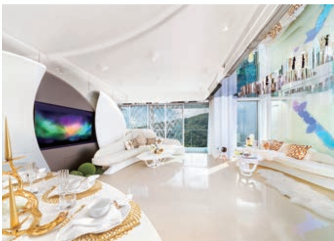
富豪 • 山峯之住宅單位的客廳