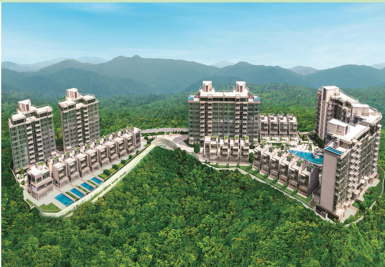
富豪 • 山峯 — 位於新界沙田九肚麗坪路 23 號之豪華住宅發展項目