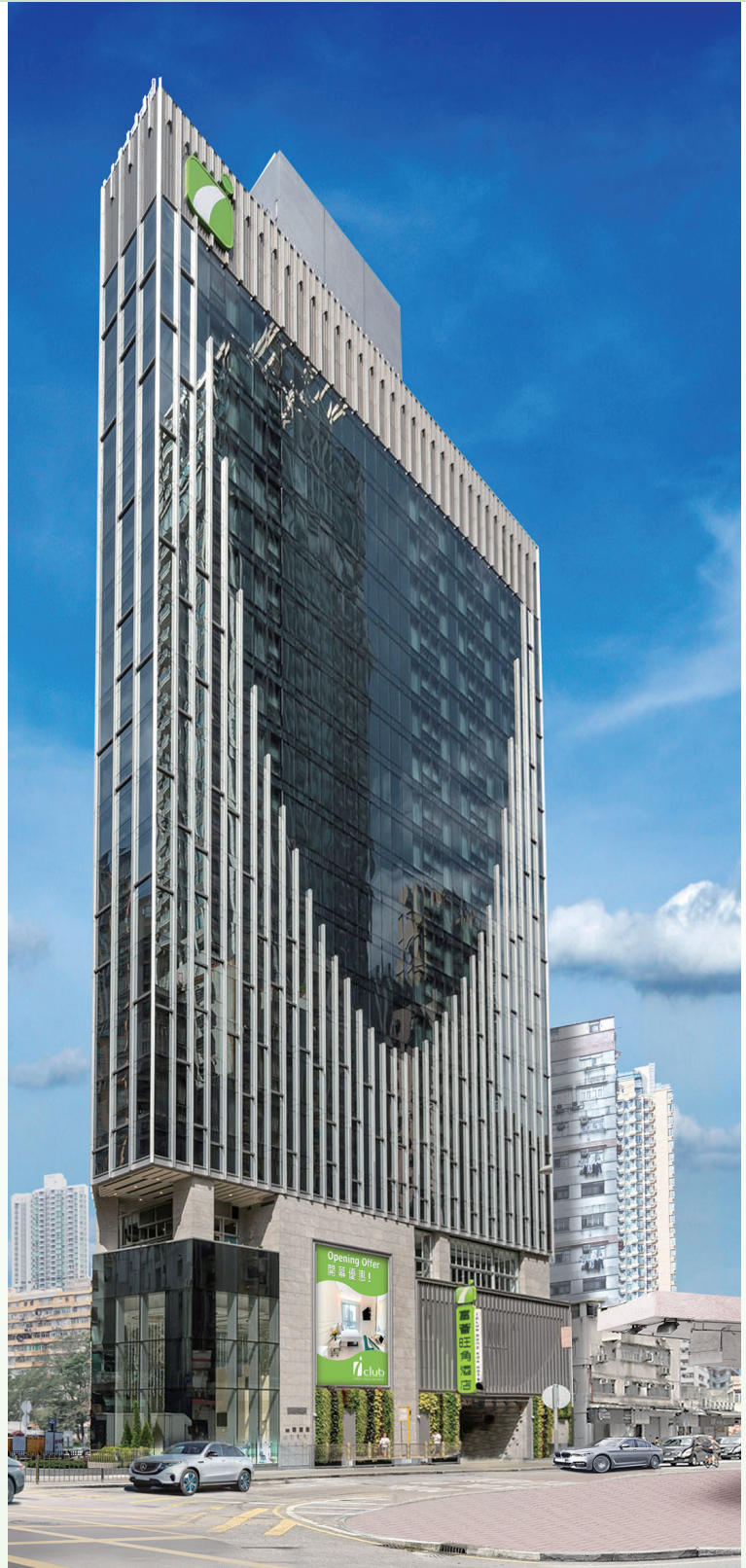
富薈旺角酒店 — 位於香港九龍旺角晏架街2號