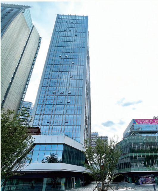
酒店及商業/寫字樓大樓