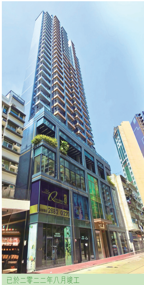
已於二零二二年八月竣工