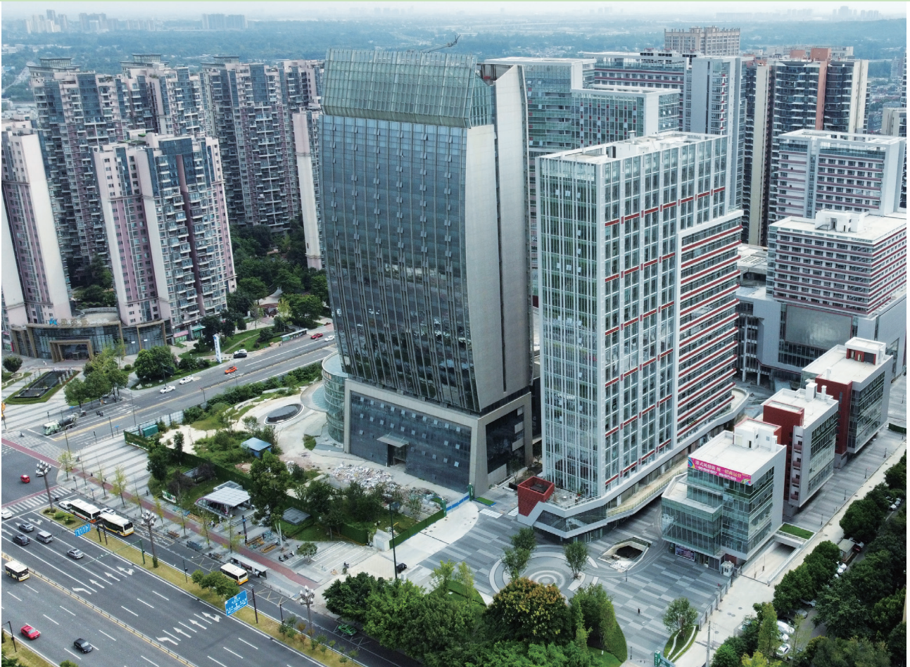
富豪國際新都薈 — 酒店及商業/寫字樓大樓