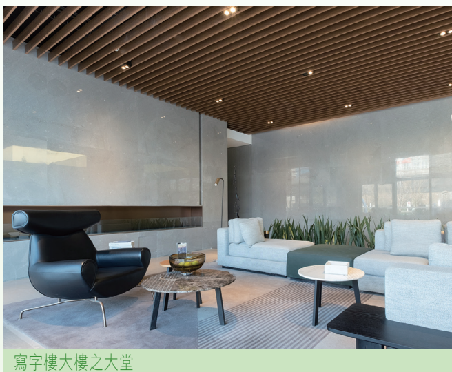
寫字樓大樓之大堂