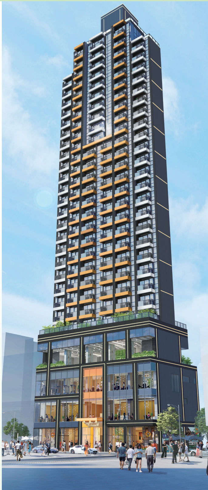
尚瓏(*) - 位於香港皇后大道西 160 號之商業/住宅發展項目