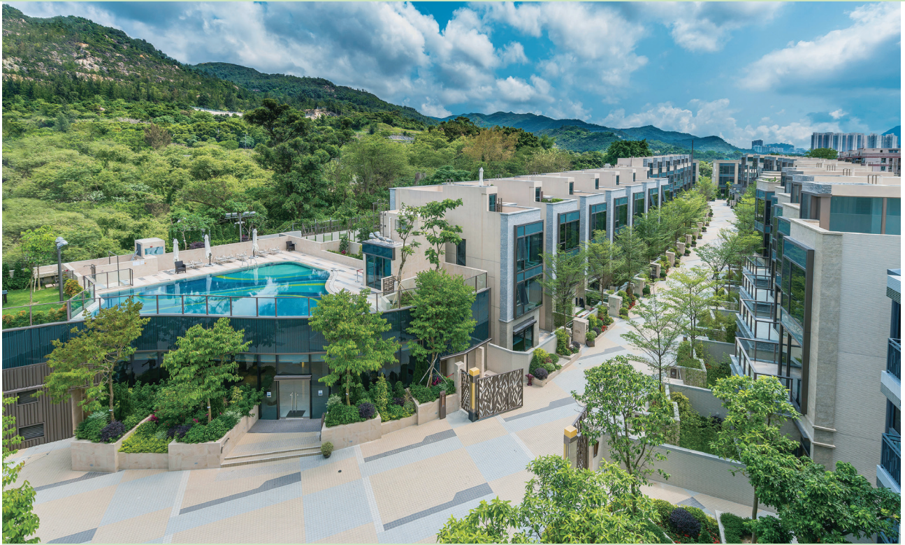
富豪 • 悦庭 — 位於新界元朗丹桂村路65至89號之住宅發展項目之花園洋房