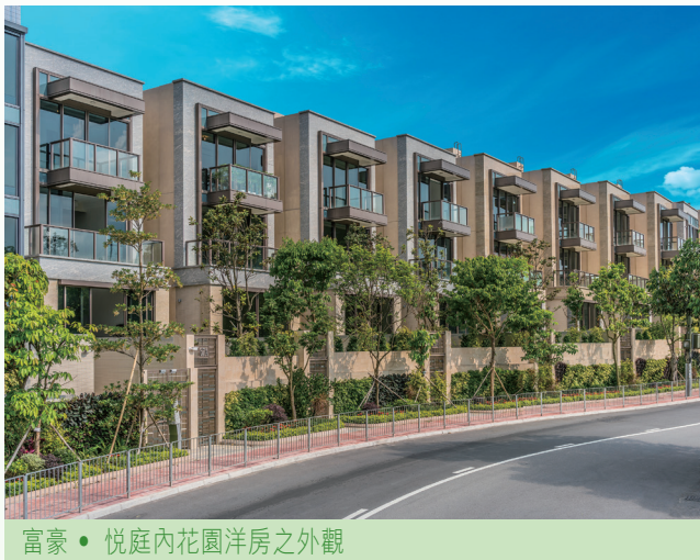
富豪 • 悦庭內花園洋房之外觀