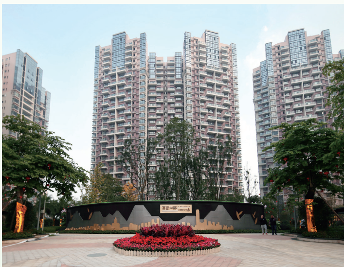
富豪公館(第一期及第二期) — 富豪國際新都薈之住宅部分