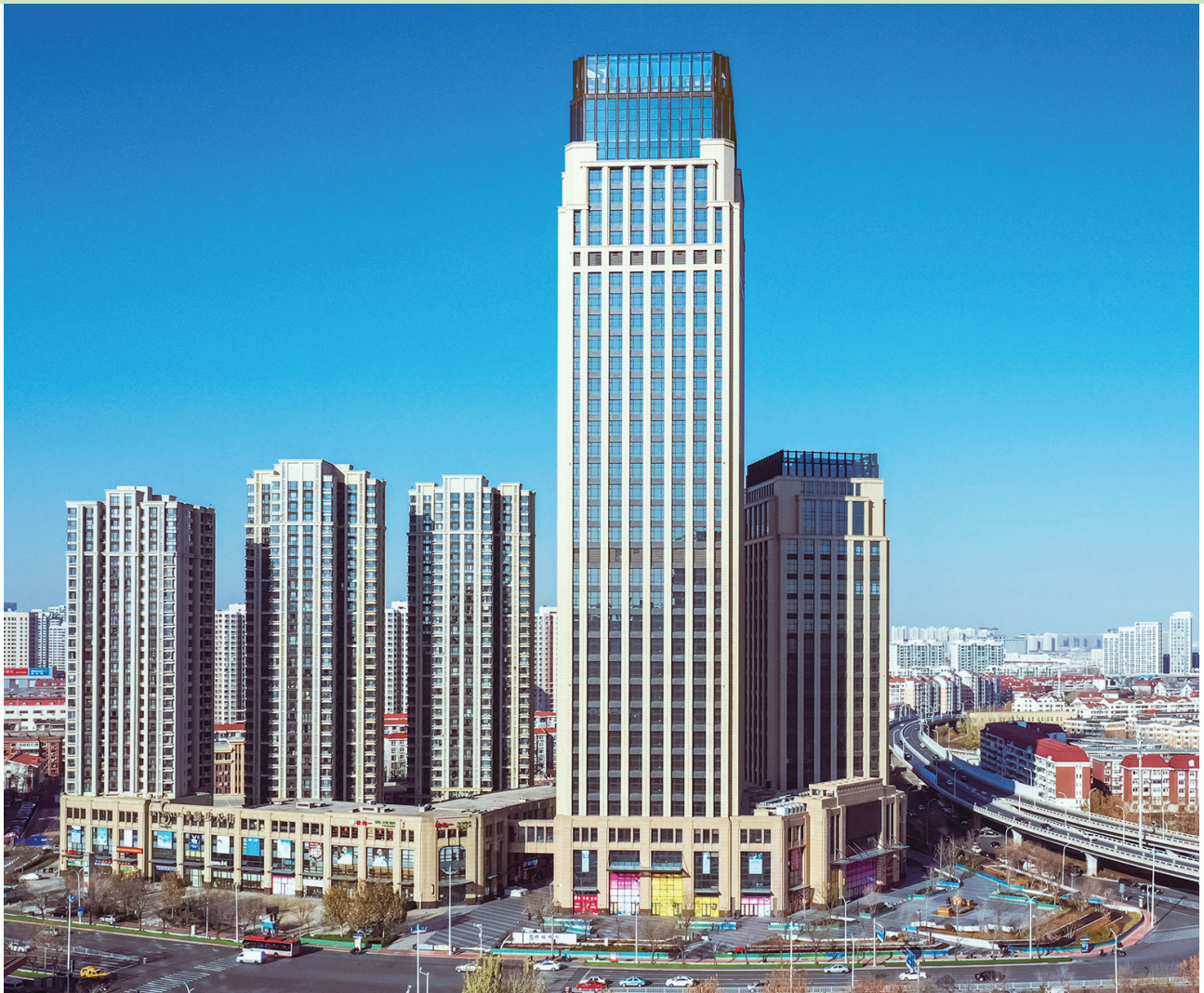
富豪新開門 – 位於天津河東區黃金地段之商業/寫字樓/住宅綜合發展項目