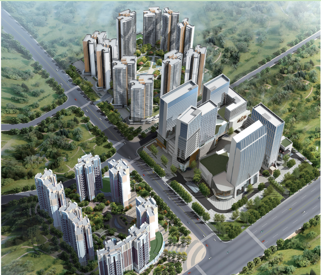
富豪國際新都薈 — 位於四川成都新都區之住宅/商業/寫字樓/酒店綜合發展項目(*)