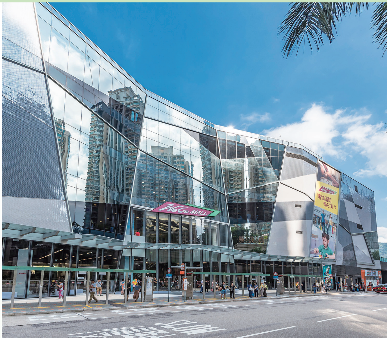
We Go MALL — 位於新界沙田馬鞍山保泰街16號之購物商場