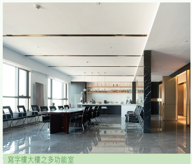
寫字樓大樓之多功能室