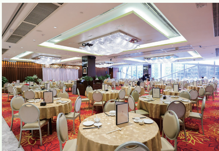
中餐廳 — 龍庭