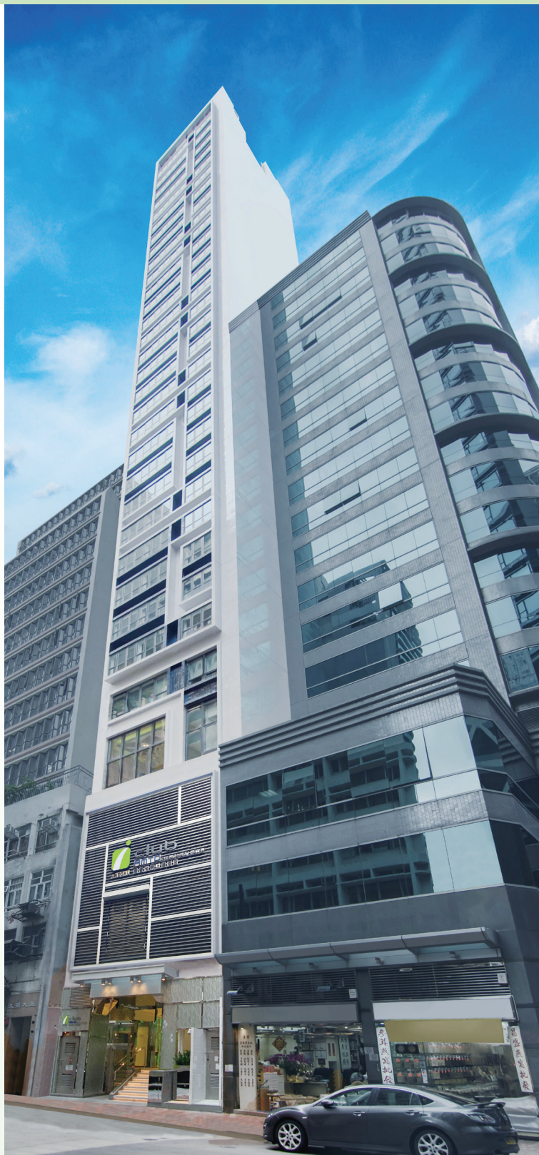
富薈尚乘上環酒店 — 位於香港上環文咸西街5號