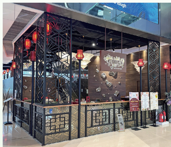
中餐廳 — 龍門客棧